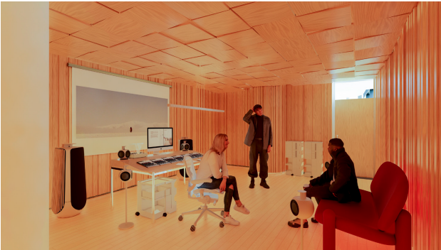
이머시브 사운드 스튜디오